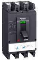
EasyPact™ CVS ขนาด Frame 400 - 630A