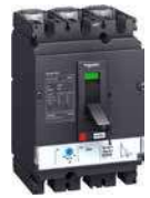
EasyPact™ CVS ขนาด Frame 100 - 250A